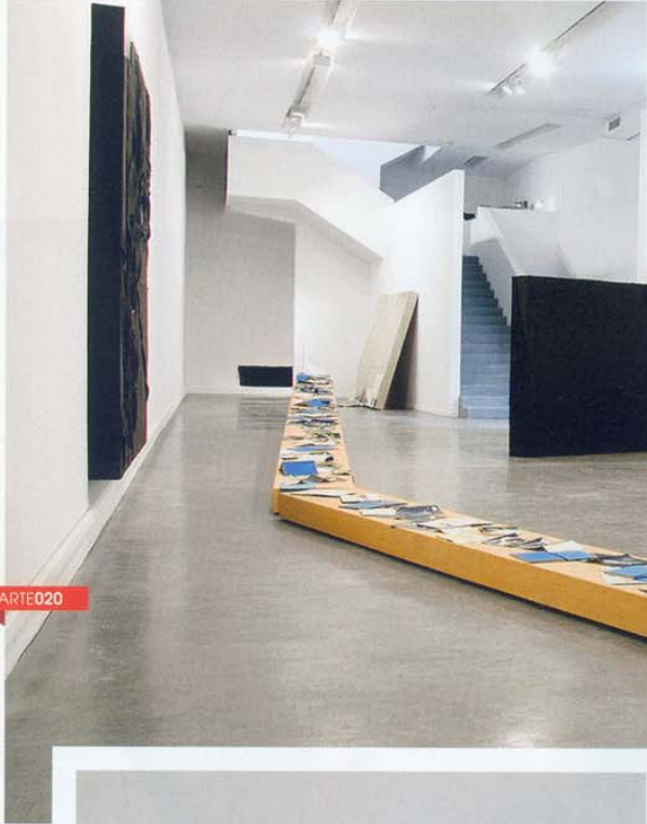
Arriba/ One foot in the grave (Reclining), 2010. Centro/ Gravity Moves Me, 2011. Abajo/ Golden Age, 2009.