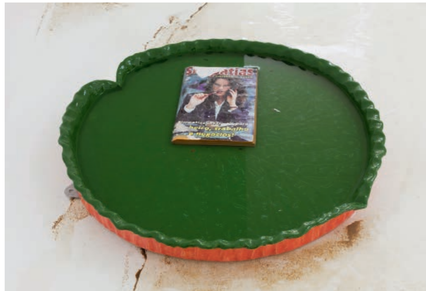
„MY HISTORY OF FLOW“, 2016, INSTALLATIONSANSICHT S.A.L.T.S., BASEL