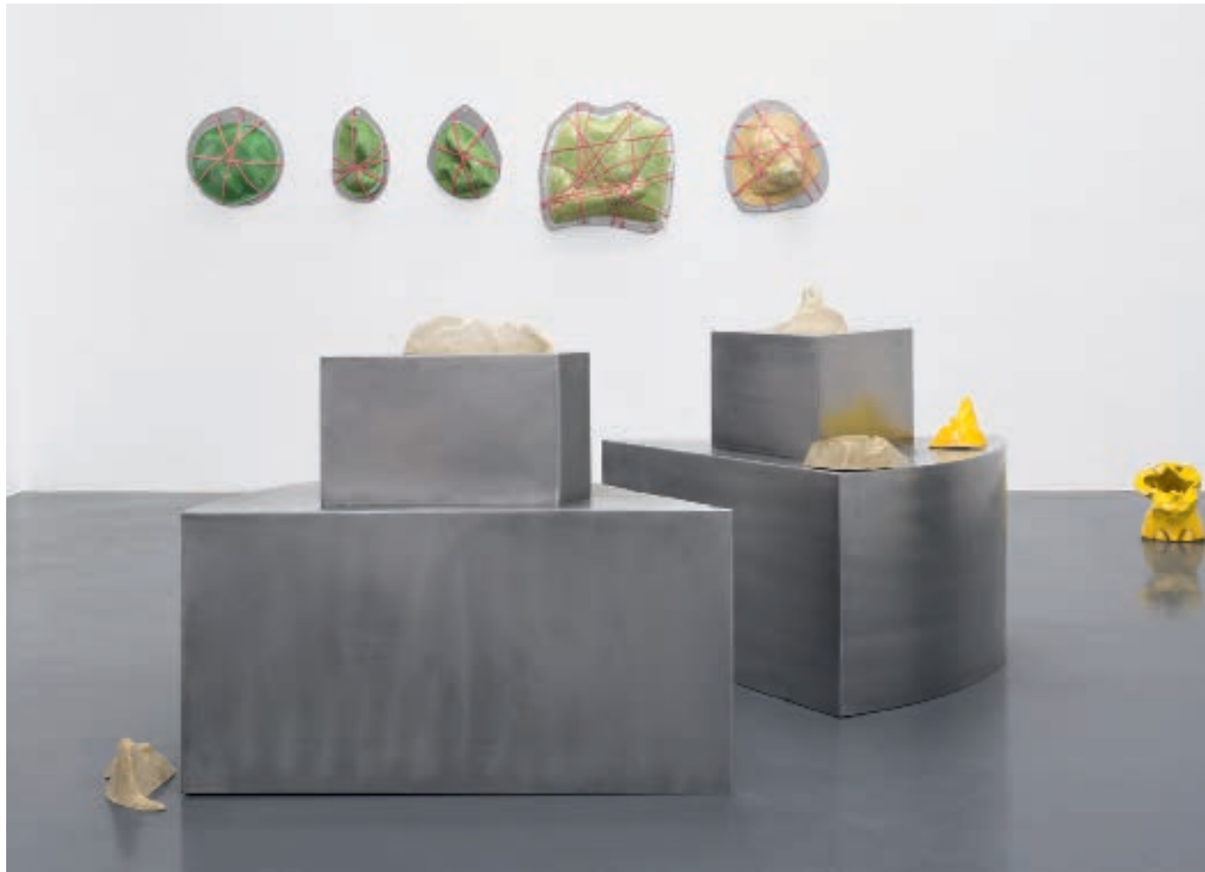
„MY PIECE OF CAKE + HIS PIECE OF CAKE“, 2016 Bildhauerei mit neuem Twist: Mit den Formen an der Wand kann ein Sammler die Sandskulpturen selbst anfertigen

Getriebe des Kunstbetriebs geredet“, grinst Henke. Was man vielleicht noch erwähnen sollte: Die Wände der Rotunde der Schirn waren schreiend pink gestrichen, die Säulen silbern. „Schrei mich nicht an, Krieger!“ lautete der Titel der Installation. Die Geschichte dazu darf man sich selbst vorstellen.