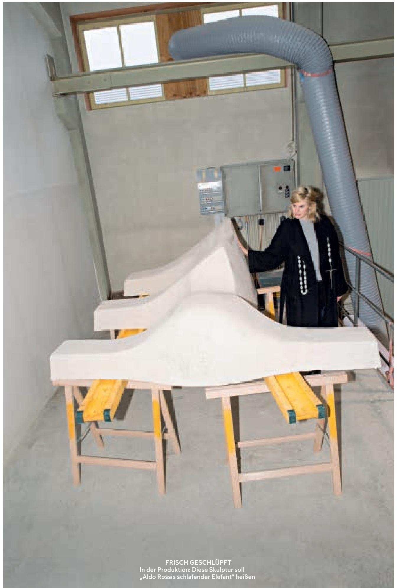
FRISCH GESCHLÜPFT In der Produktion: Diese Skulptur soll „Aldo Rossis schlafender Elefant“ heißen