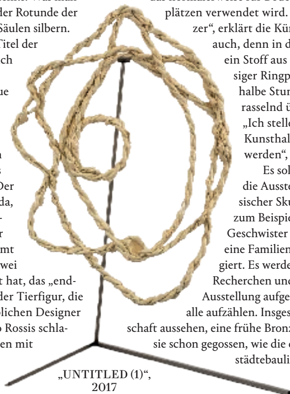
„UNTITLED (1)“, 2017