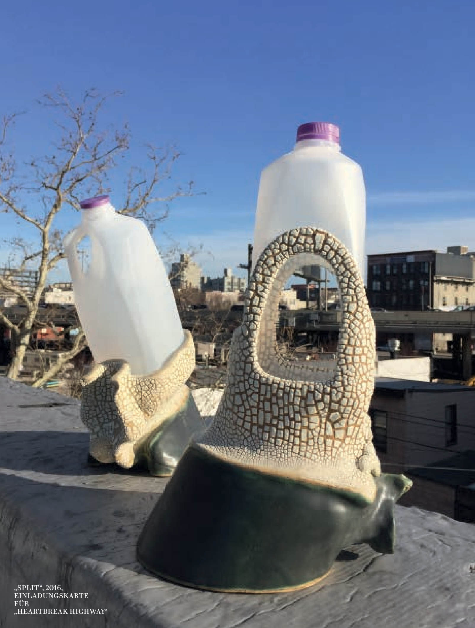
„SPLIT“, 2016, EINLADUNGSKARTE FÜR „HEARTBREAK HIGHWAY“