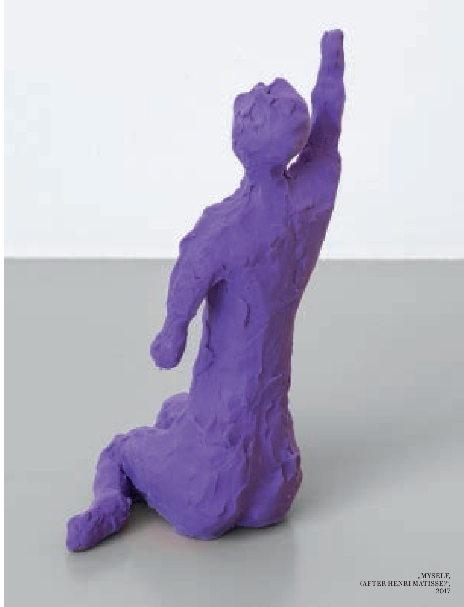
„MYSELF, (AFTER HENRI MATISSE)“, 2017